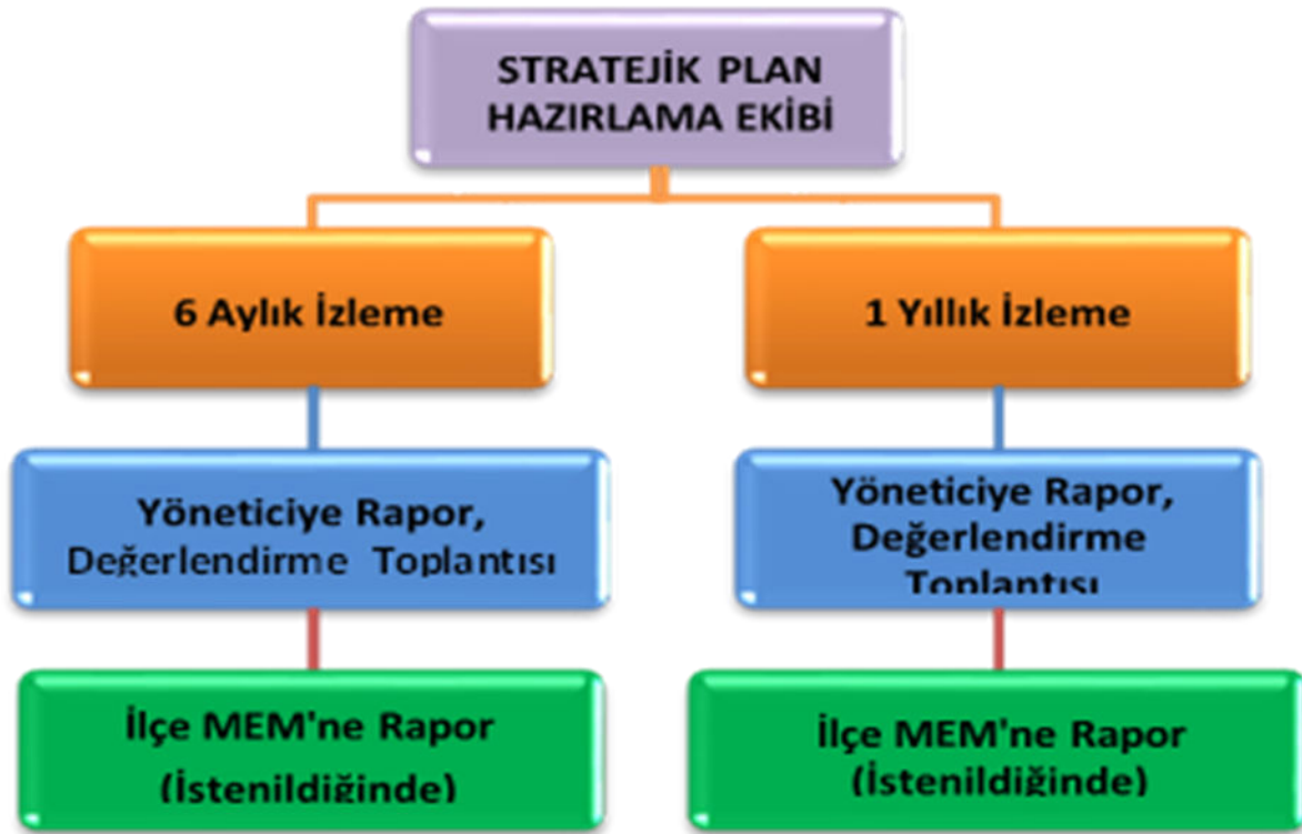
Şekil 3: İzleme ve Değerlendirme Süreci

Müdürlüğümüzün 2019-2023 Stratejik Planı İzleme ve Değerlendirme sürecini ifade eden İzleme ve Değerlendirme Modeli hazırlanmıştır. Müdürlüğümüzün Stratejik Plan İzleme- Değerlendirme çalışmaları eğitim-öğretim yılı çalışma takvimi de dikkate alınarak 6 aylık ve 1 yıllık sürelerde gerçekleştirilecektir. 6 aylık sürelerde rapor hazırlanacak ve değerlendirme toplantısı düzenlenecektir. İzleme-değerlendirme raporu, istenildiğinde İlçe Millî Eğitim Müdürlüğü'ne gönderilecektir. Ayrıca ilçemizin Mülki İdari Amirine sunulacaktır. 1 yıllık izleme-değerlendirme çalışmaları, Stratejik Planımızda yer alan hedeflerin yıllık düzeyde ifade edildiği Performans Programı ve yılsonunda gerçekleşme düzeylerinin belirlendiği Faaliyet Raporu hazırlanarak yapılacaktır.